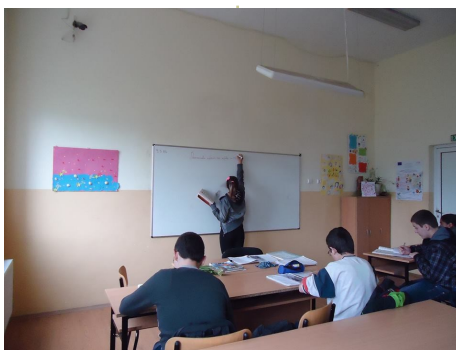
Учениците са в ролята на техните учители