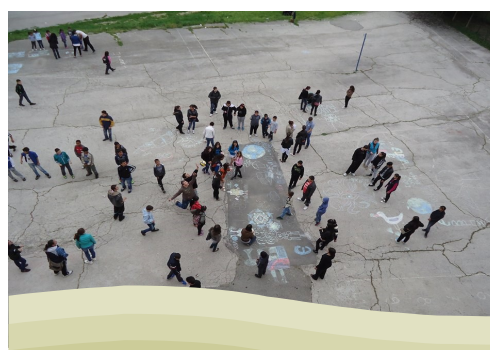
На 9 май в двора на СОУ гр. Смядово