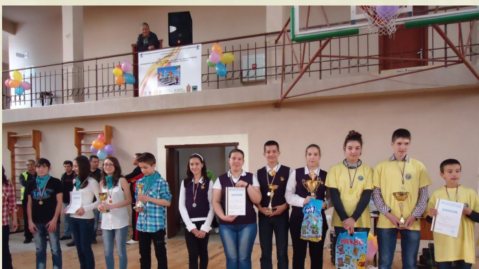
Победителите в 14 Национална ученическа викторина - май, 2014