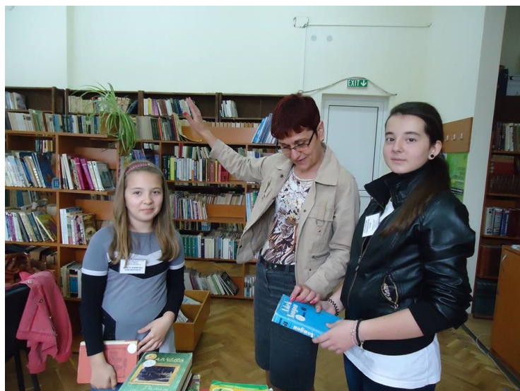
В библиотеката на СОУ Смядово