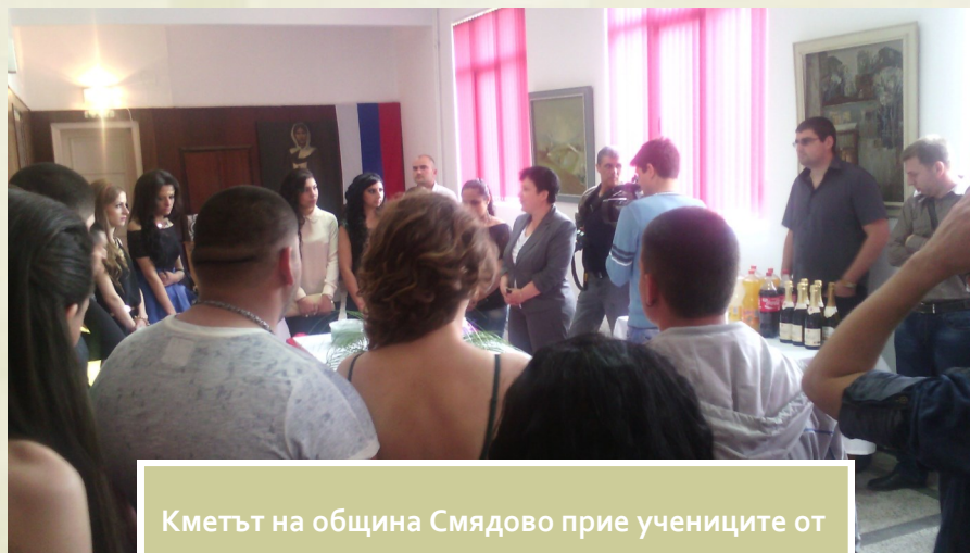
Кметът на община Смядово прие учениците от Випуск 2013/2014 на СОУ Смядово