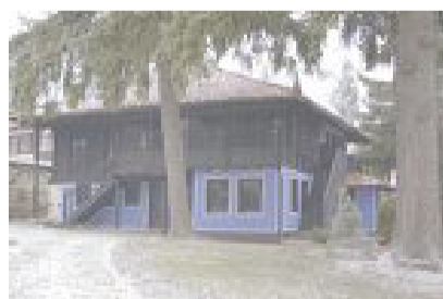
Родната къща на Димчо Дебелянов

Дебелянов е автор на стихосбирките - "Посвещение", "Копнежи", "Замиращи звуци", "Станси", "През април", "Спомени", "Под тъмни небеса", "Под сурдинка", "Ранни стихотворения" и на произведенията - "Легенда за разблудната царкиня", "Хумор и сатира", "Проза". През 1906 г. в сп. "Съвременност" са отпечатани първите публикувани творби на поета: "На таз, която в нощи мълчаливи", "Когато вишните цъфтяха" и други. Пише репортажи за в. "Ден" (1903-1923 г.) и в. "Балканска трибуна" (1906-1908 г.). Сътрудничи на "Българска сбирка", "Съвременник", "Нов път", "Оса" и много други. В хумористичните издания печата сатирични творби с псевдоними: Аз, Амер, Тафт, Сулбатьор и други.