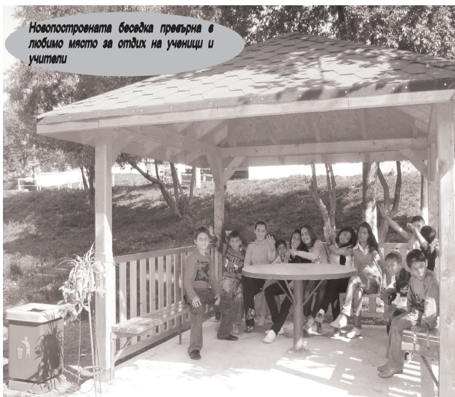
Новопостроената беседка превърна в любимо място за отдих на ученици и учители