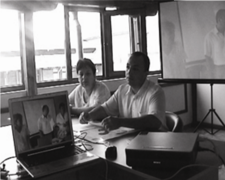
Продължение от стр.1