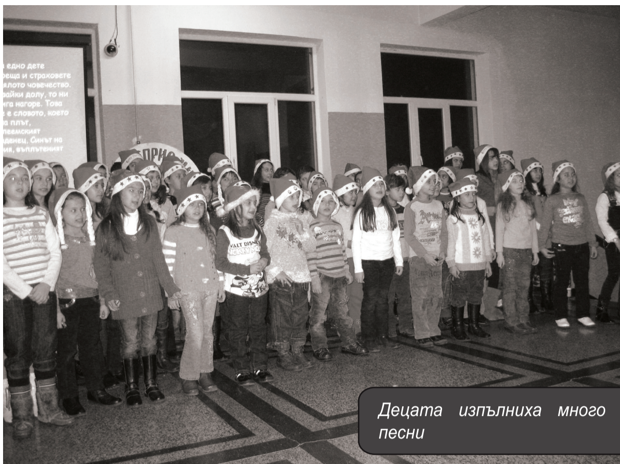
Деца изпълниха много коледни песни