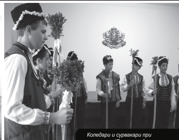
Коледари и сурвакари при читалище "Братство" благословиха за здраве и берекет