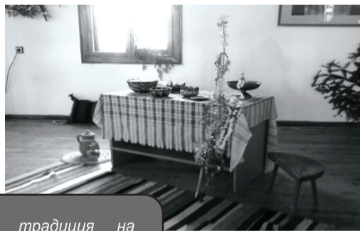
По традиция на трапезата на Бъдни вечер срещу Коледа има нечетен брой постни ястия