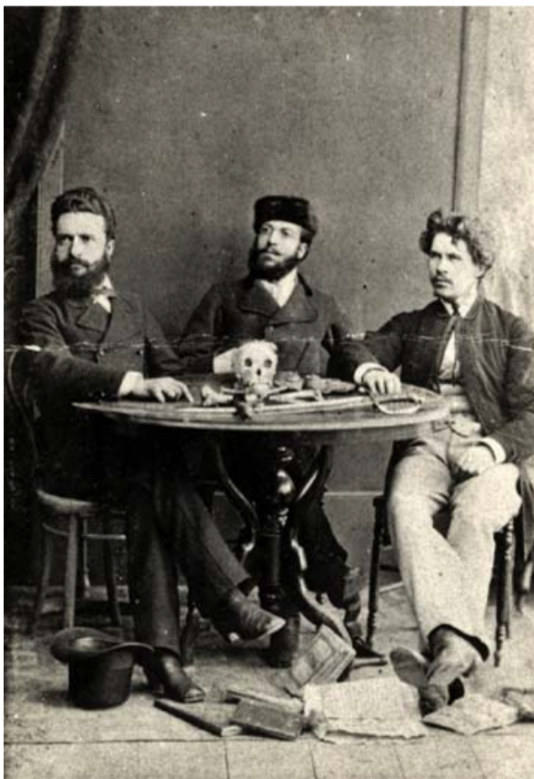
Христо Ботев, Никола Славков и Иван Драсов в Румъния 1875 г.

На 6 януари 2008 година се навършват 160 години от рождението на ненадминатия поет, пламенен публицист и всеотдаен борец за национална свобода Христо Ботев. Чрез творчеството си той открива за България Европа и европейските ценности още преди век и половина. Христо Ботев е не само велик българин. Той е един от великите европейци в новата история. Ботев ни е нужен с гениалната си прозорливост и съвременното звучене на идеите му. Той е личност от европейски мащаб, оставил следа в политическата история на Европа през 19 век.