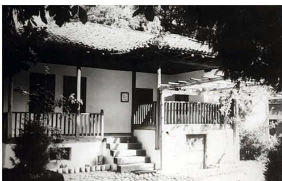
Родната къща на Христо Ботев в Калофер

От Козлодуй четата на Ботев се отправя към Балкана. Много малко българи се присъединяват към четниците. Четата води боеве с преследващите я турски потери. На 2 юни е последния тежък бой. Привечер след сражението куршум пронизва Ботев в подножието на връх Вола във Врачанския балкан./с