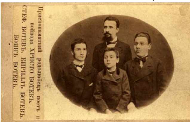
Христо Ботев с братята си Стефан, Боян, Кирил май 1876 г. Букурещ