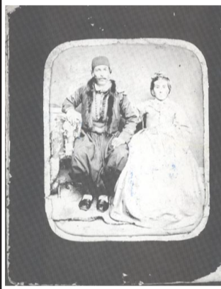
Родителите на Христо Ботев

На 6 януари 2008 година се навършват 160 години от рождението на ненадминатия поет, пламенен публицист и всеотдаен борец за национална свобода Христо Ботев. Чрез творчеството си той открива за България Европа и европейските ценности още преди век и половина. Христо Ботев е не само велик българин. Той е един от великите европейци в новата история. Ботев ни е нужен с гениалната си прозорливост и съвременното звучене на идеите му. Той е личност от европейски мащаб, оставил следа в политическата история на Европа през 19 век.