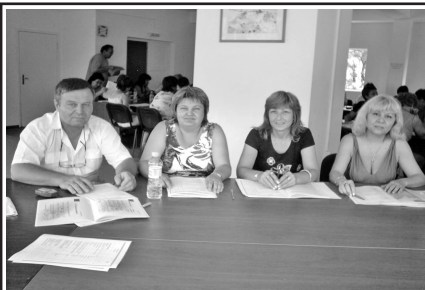
ТЕНДЕНЦИИ В РАЗВЕТИЕТО НА СРЕДНОТО ОБРАЗОВАНИЕ

От 25 до 27 юни 2007 г. директорите на училища от Община Смядово преминаха курс на обучение по Управление на образованието в Националния институт за обучение на директори в гр. Баня. Застъпени бяха модулите „ Бюджет“, „ Проекти“ и „ Психология на управлението“. Обучението е организирано и финансирано от МОН и ще бъде едно от задължителните изисквания за заемане на длъжността „директор“. В рамките на курса експерти от Министерство на финансите и от МОН разясниха новите тенденции в развитието на средното образование и в работата на училищния директор.